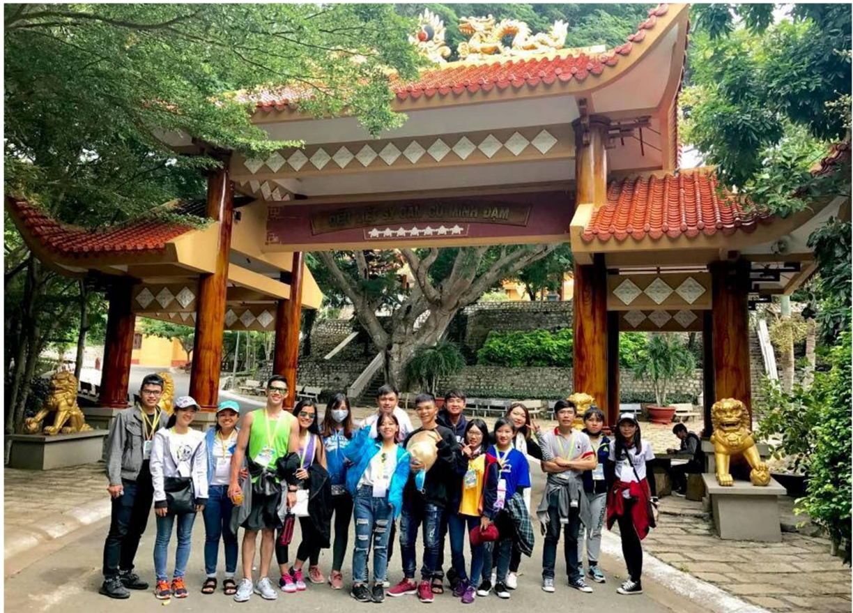
Hình 22- Trại sinh leo lên đỉnh và tham quan

9h: tới núi MINH ĐẠM. Các bạn sẽ leo lên núi và tham quan để biết thêm một di tích lịch sử nổi tiếng nữa.