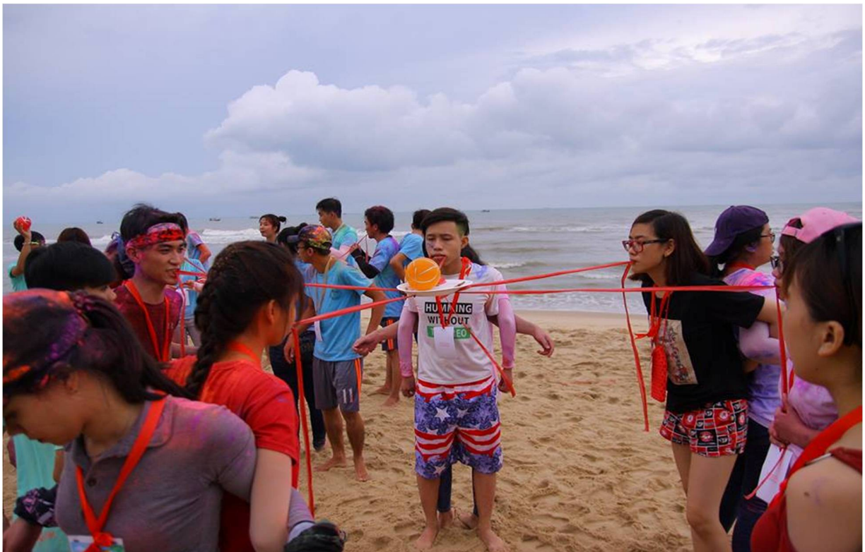
Hình 14- Trò Bê bóng bỏ Bô