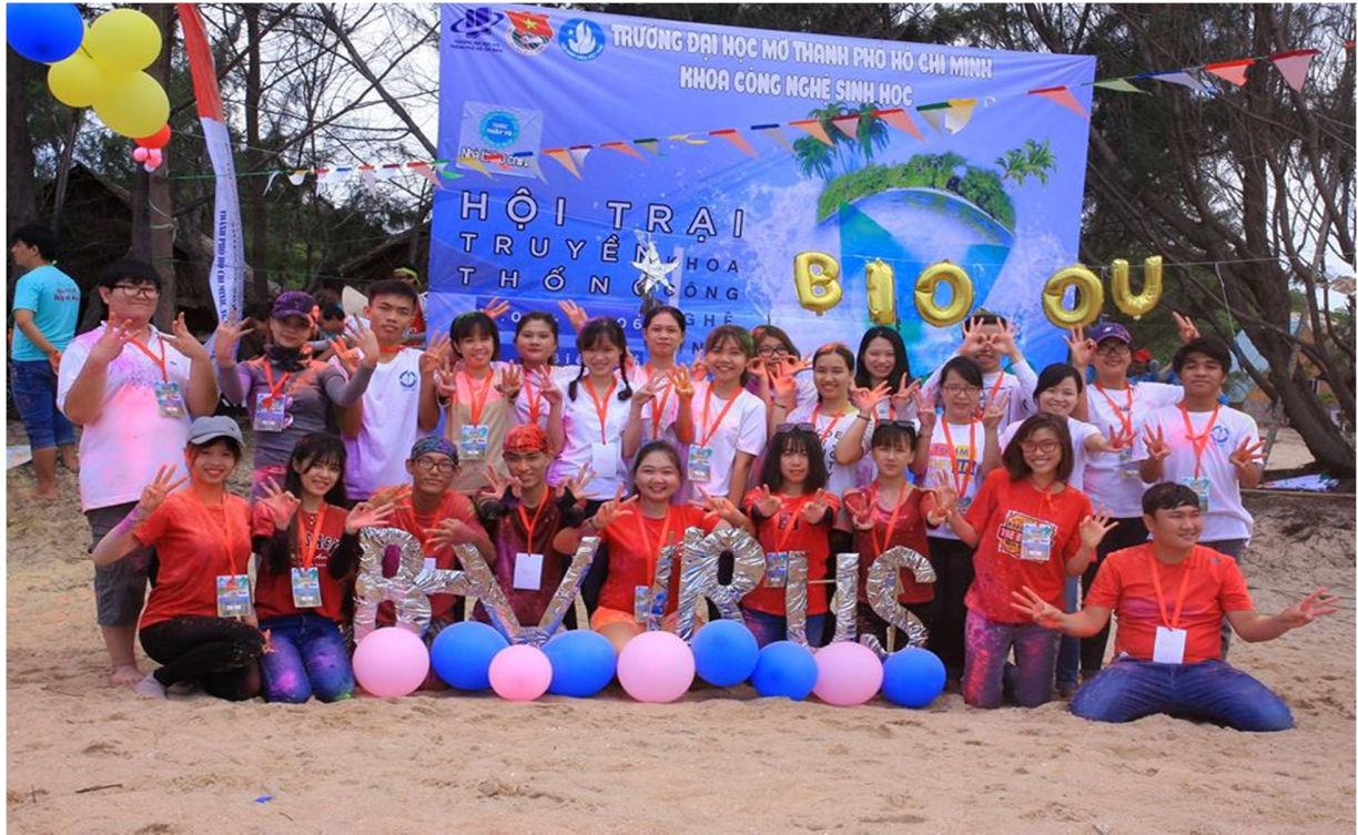
Hình 7- Trại sinh thuộc Trại 3