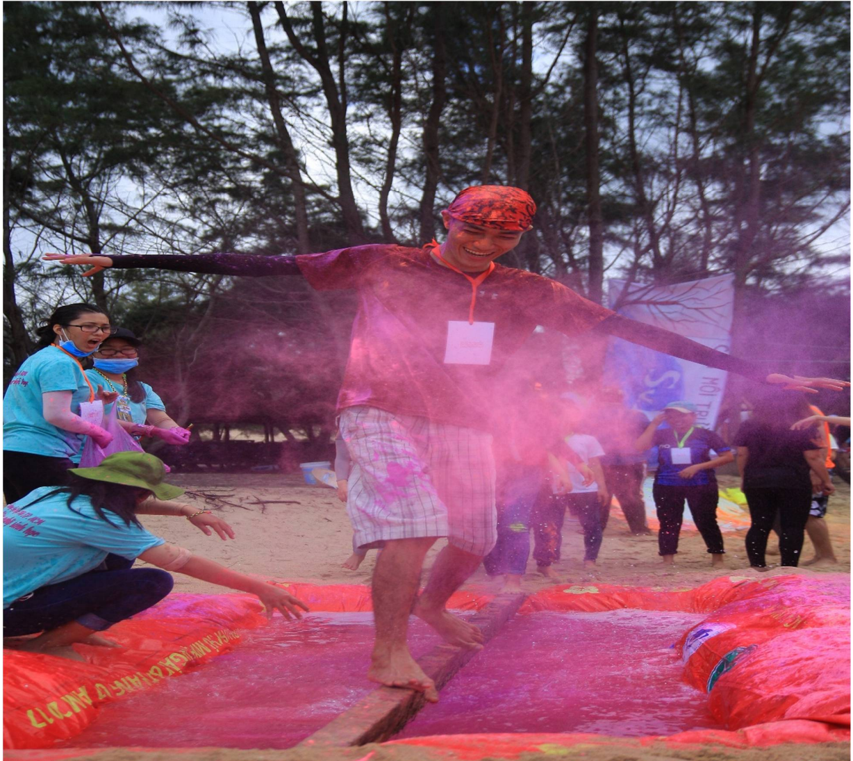
Hình 5- Trò chơi nhập trại giành cho trại sinh

Sau khi vượt qua hết các phần trò chơi đó, mỗi trại sẽ được chụp 1 tấm ảnh lưu niệm với poster của chương trình .