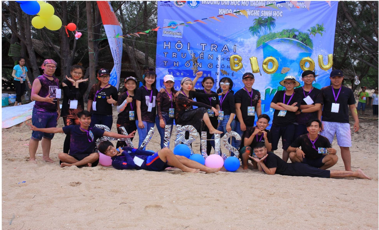
Hình 6- Trại sinh thuộc Trại 1