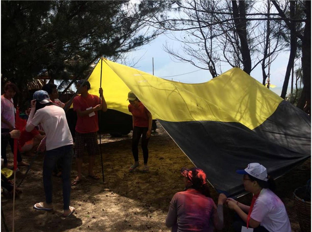
Hình 11- Trại sinh tiến hành DỰNG TRẠI

10h: Tham gia trò chơi để tìm về cho trại mình, lều và bạt để dựng trại cùng với sự hướng dẫn của nhóm trưởng. Kèm theo đó là một phần bánh nhỏ cho mỗi trại nữa .