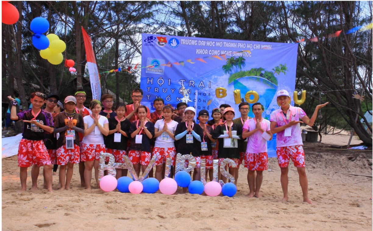
Hình 9- Trại sinh thuộc Trại 5