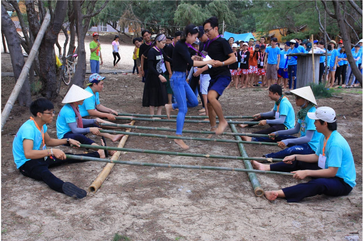
Hình 4- Trò chơi nhảy sạp đôi giành cho các trại sinh