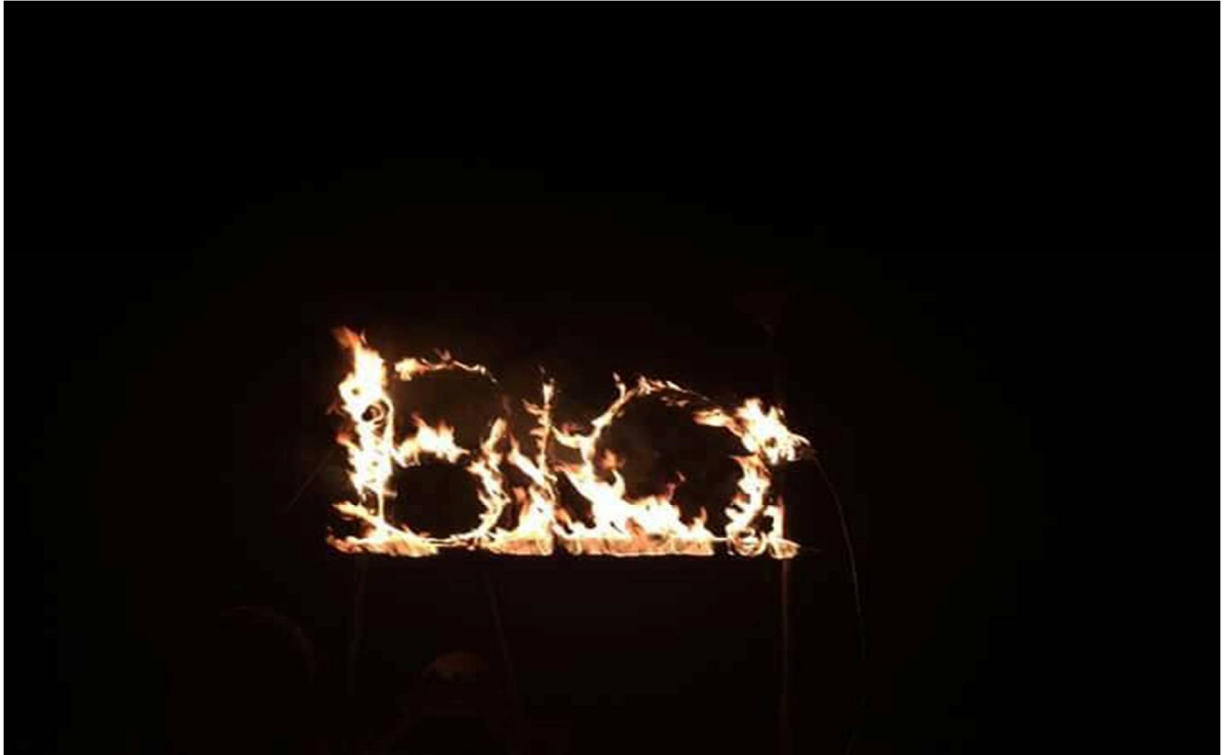
Hình 21- Lửa trại khoa Công Nghệ Sinh Học-Bio

23h30: Sau khi kết thúc phần lửa trại với nhiều trò chơi nhỏ do bạn hoạt náo viên đưa ra . Sẽ đến với một trò chơi vô cùng hấp dẫn khác ..... HÀNH QUÂN ĐÊM . Thử thách cuối cùng giành cho các trại sinh thể hiện tinh thần đoàn kết, đồng đội của mình. Với không gian tối của màn đêm, tiếng sóng vỗ rì rào từ biển, ánh đèn lấp lòe của đèn pin, và những tiếng rú rùng rợn sau buổi cây( BTC tạo ra cả). Khung cảnh như thế, mỗi trại sẽ phải trải qua từng trại trò chơi để hoàn thiện được một tấm bản đồ tìm ra nơi mà trại trưởng của mình đang bị bắt giữ. Trại nào giải cứu trại trưởng mình đầu tiên sẽ đội chiến thắng .