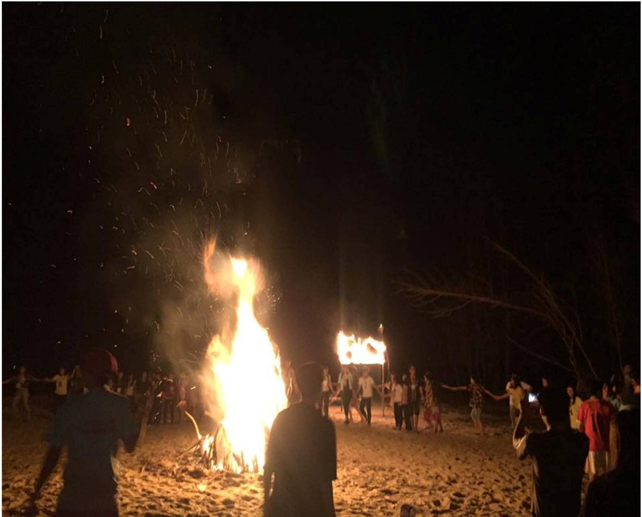
Hình 20- Đêm lửa trại đã bắt đầu

Đội lửa trại đã rất kì công để chuẩn bị nên phần lửa trại cực kì hoành tráng. Trước phần đốt lửa trại các trại sinh được xem một phần hoạt náo lửa trại vui nhộn . GIỜ G đã điểm,ngọn lửa vụt sáng làm cho các bạn hò hét lên, ánh sáng ấy làm cho tinh thần của các trại sinh như được dâng lên , các bạn xếp thành một vòng tròn, cùng nhau đi, cùng nhau hò hét thật to : “BIO...BIO...BIO....”