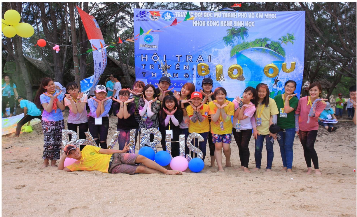
Hình 7- Trại sinh thuộc trại 2