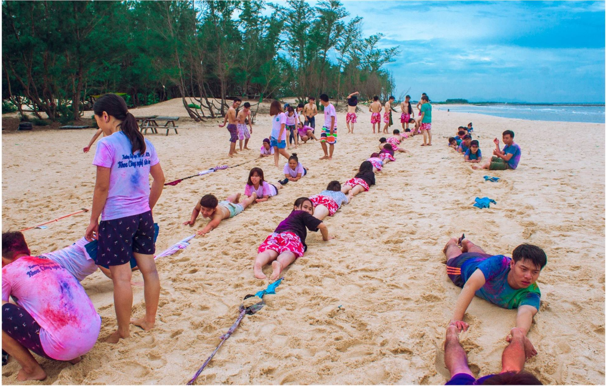
Hình 16- Trò chơi AI DÀI NHẤT, các đội đang cố gắng dài hết mức