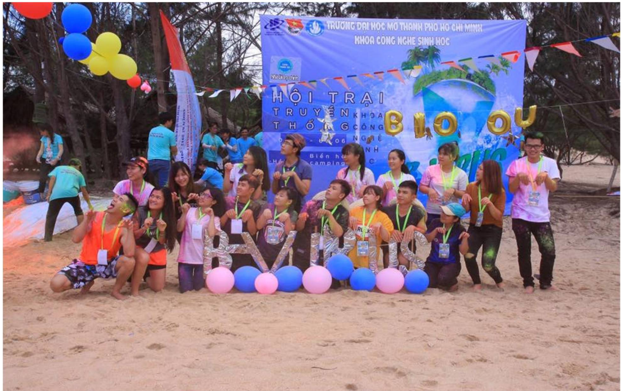
Hình 8- Trại sinh thuộc Trại 4