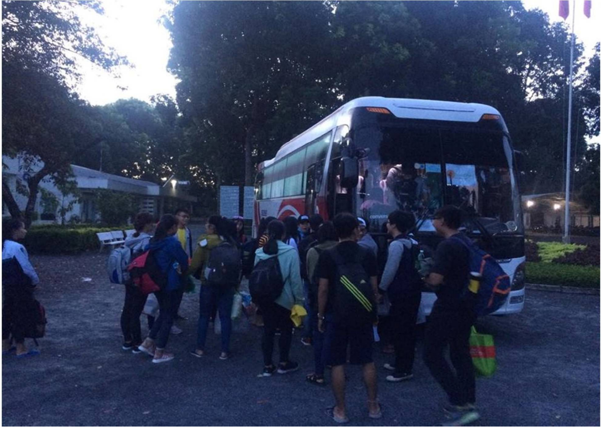
Hình 1- Trại sinh tập trung trước giờ khởi hành

5h30 xe xuất phát . Trên hành trình, trên xe các bạn cũng được giải trí với nhiều hình thức như karaoke, chơi trò chơi , ... tạo cảm giác vui vẻ, hưng phấn, giúp ngắn đoạn đường đi hơn nữa.