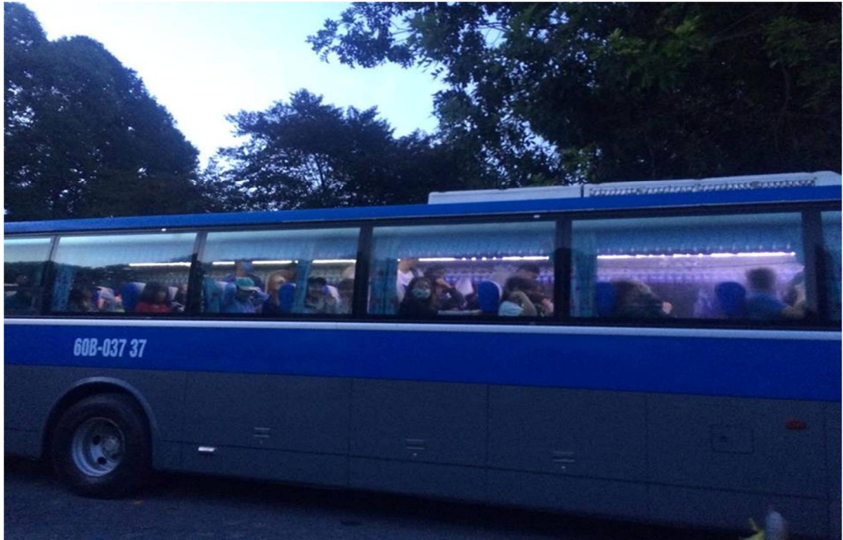
Hình 2- Xe bắt đầu xuất phát tới biển hồ camping