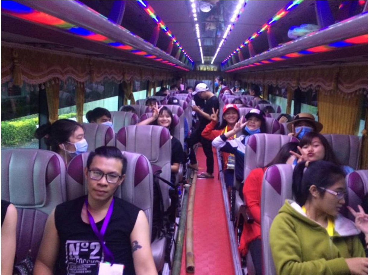
Hình 3- Các trại sinh háo hức cho chuyến đi cắm trại này