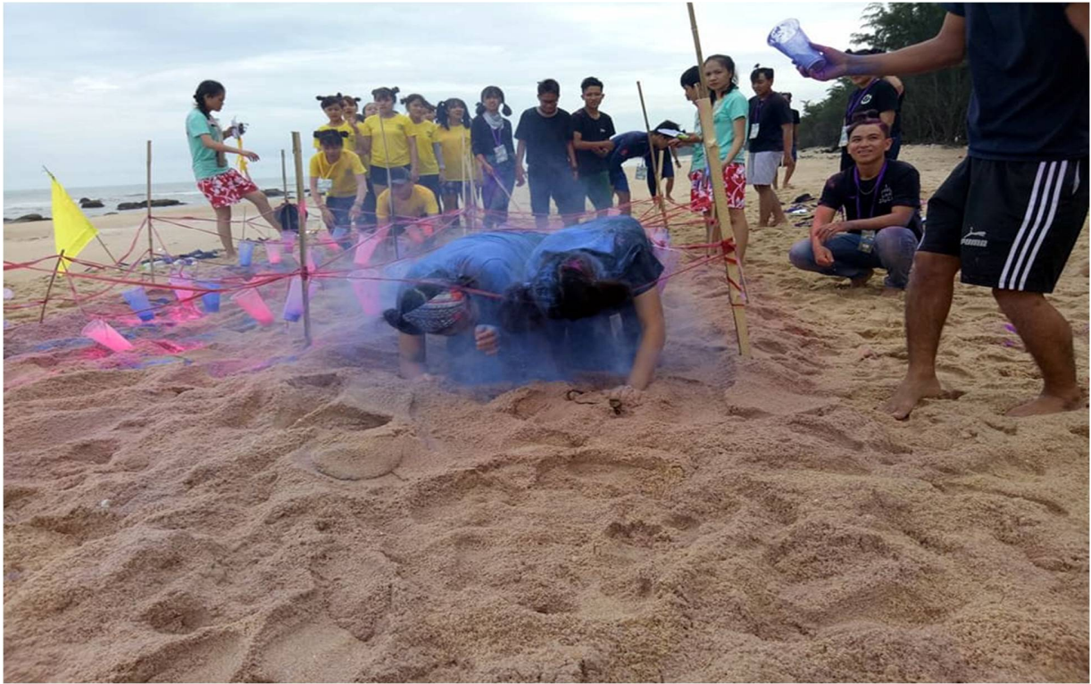
Hình 15- Trò Trường-Xoay-Đá

15h: Btc chúng tôi sẽ không cho các bạn nghỉ ngơi đâu . Chơi tiếp nhé ???