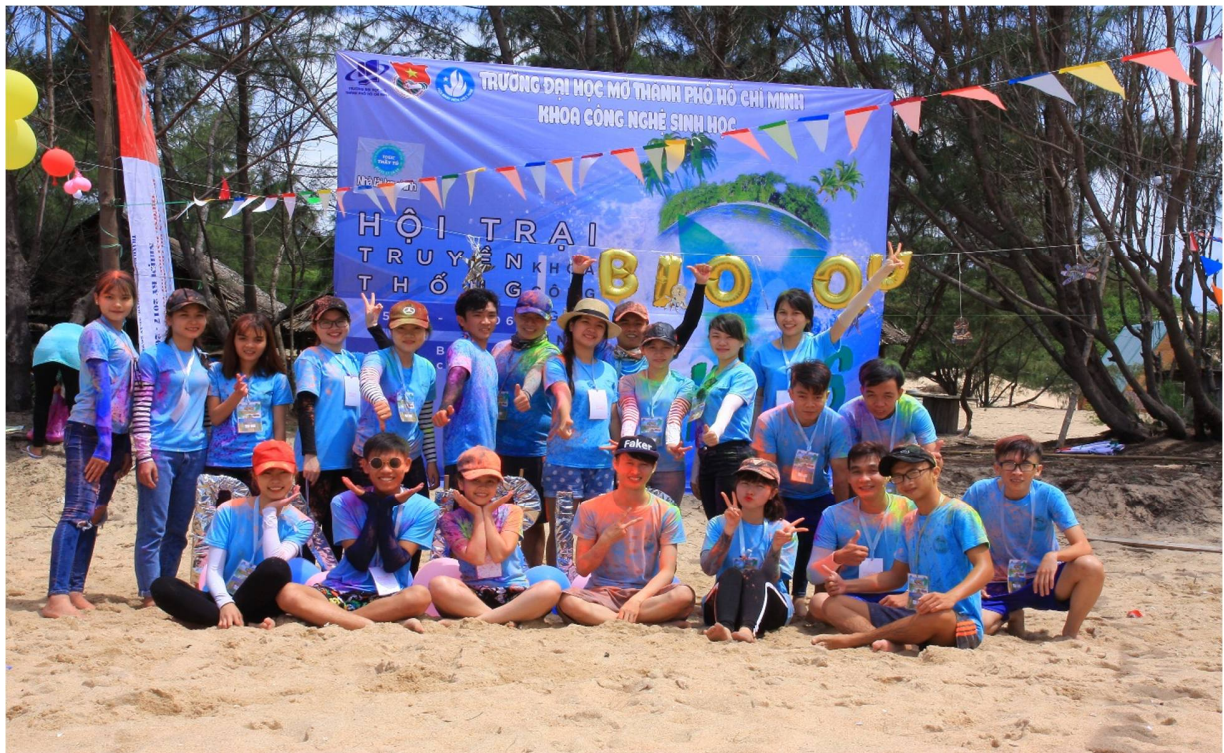
Hình 10- Trại sinh thuộc Trại 6