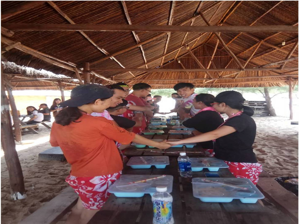
Hình 12- Trại sinh ăn cơm trưa và sinh hoạt tự do

13h30: Tham gia trò chơi lớn thôi nào . Trò chơi lớn - Teambuilding của hội trại lần này, rất đề cao tính tập thể, đoàn kết giữa các bạn trại sinh, chỉ khi các bạn đoàn kết lại với nhau thì mới thật sự thành công .