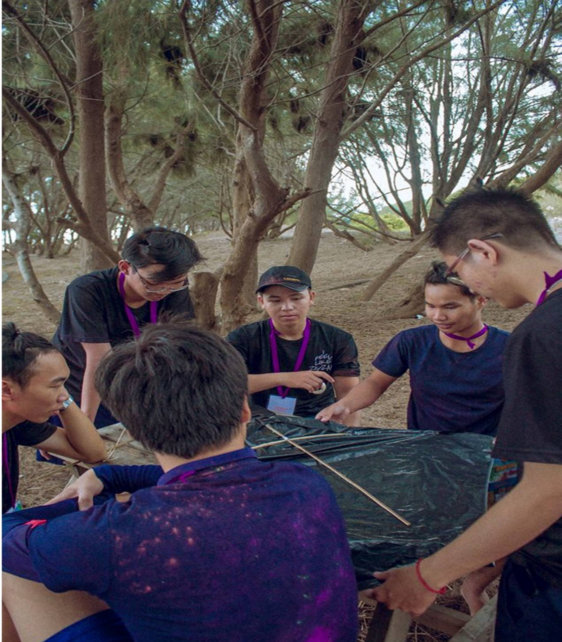
Hình 18- Trại sinh chuẩn bị diều cho cuộc thi

16h: Thi thả diều . Với dụng cụ làm diều được BTC cung cấp trước đó , các trại sẽ tiến hành thi thả diều trên biển, con diều của đội nào bay cao và lâu nhất sẽ được điểm cao và dành chiến thắng.