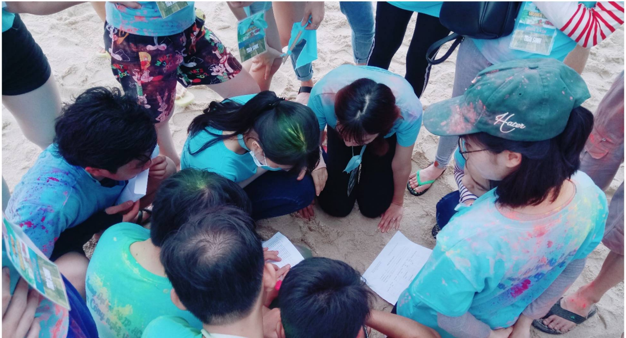
Hình 13- Các trại tiến hành giải mật thư để bước vào trò chơi