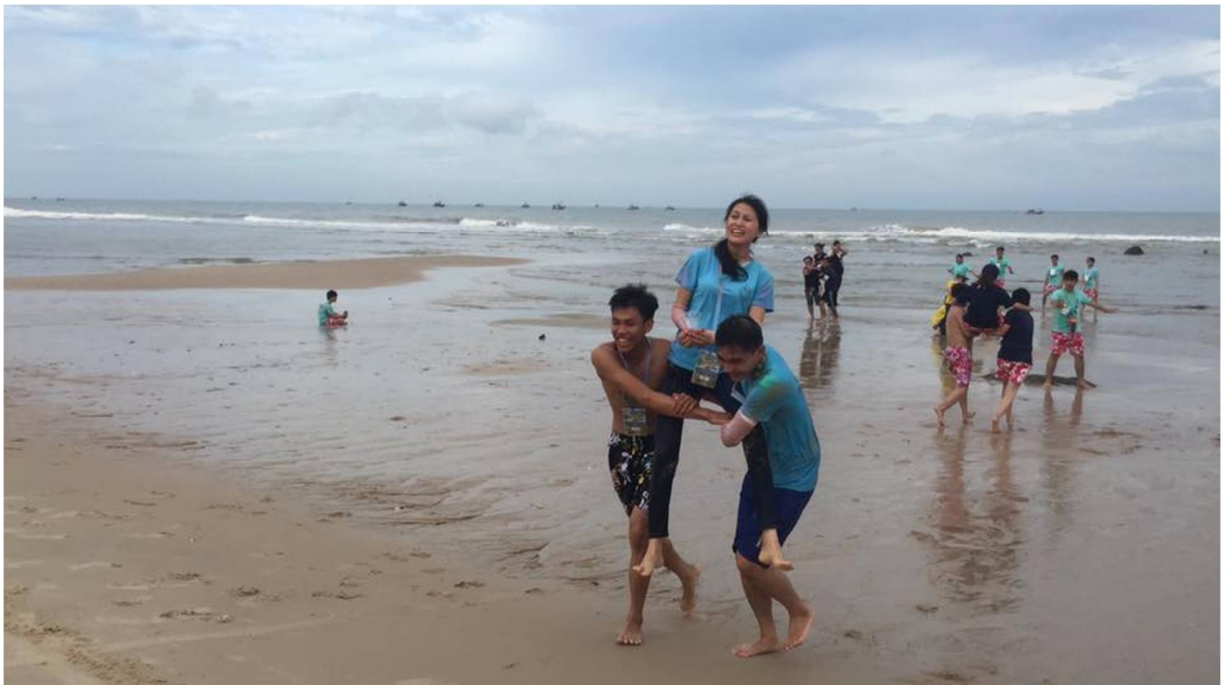
Hình 17- Rước kiệu mức nước cũng không kém phần căng thẳng