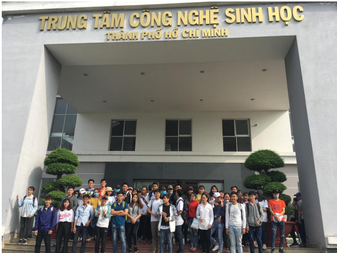
Hình 1. Giảng viên và sinh viên Khoa công nghệ sinh học trước Trung tâm Công nghệ Sinh học Thành phố Hồ Chí Minh

Dưới đây là một số hình ảnh trong chuyến tham quan thực tế: