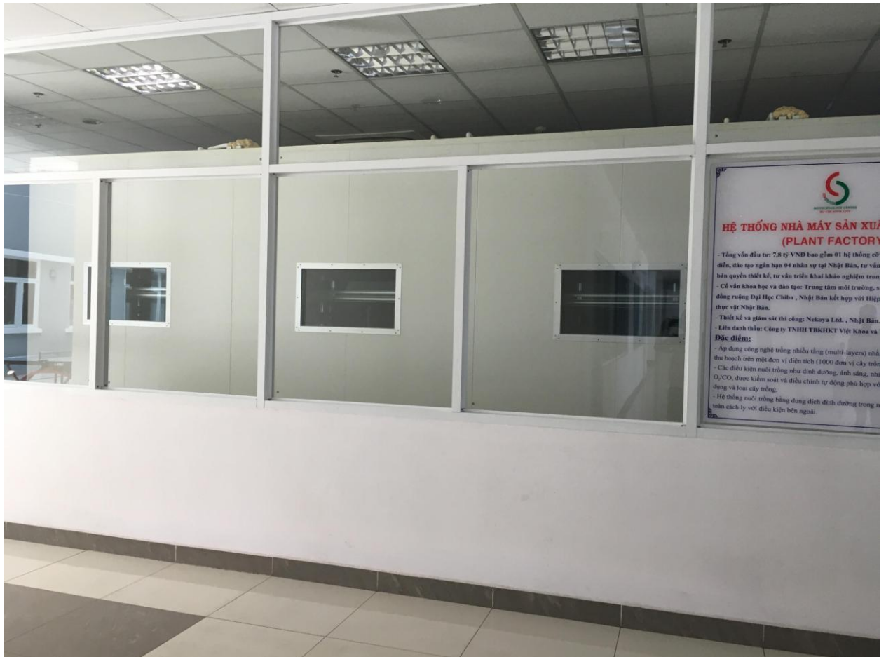
Hình 5. Tham quan Plant factory