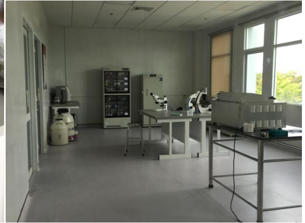
Hình 3. Tham quan phòng thí nghiệm Công nghệ Sinh học Động vật