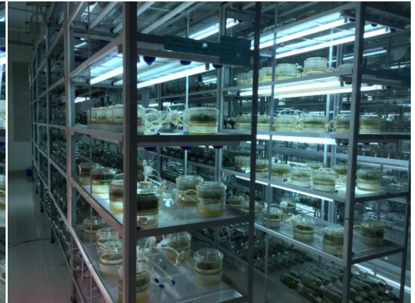
Hình 4. Tham quan phòng thí nghiệm Công nghệ Sinh học Thực vật