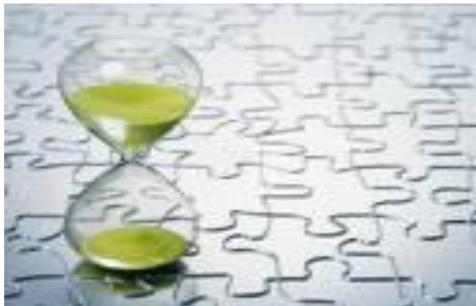
Điều tiết thời gian